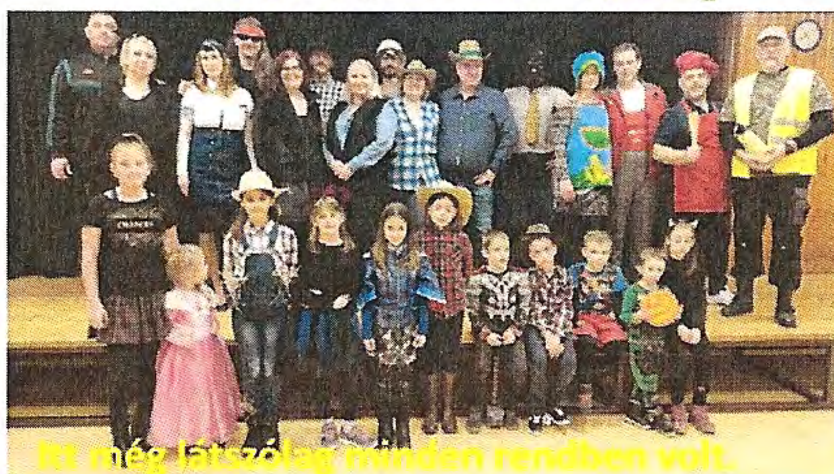
Itt még farsang minden rendben volt. Látszólag.....